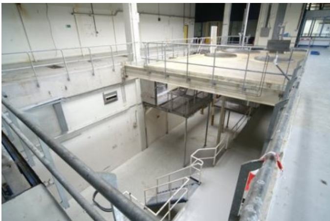
Foto: creatieve/ industriële ruimte