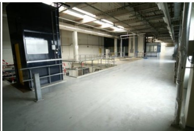
Foto: creatieve/industriële ruimte